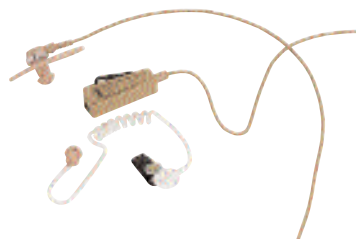
HMN9754 — 2-проводной наушник с микрофоном и тангентой (бежевый), NTN8371 — Стандартная акустическая трубка