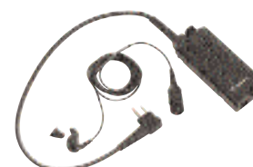
BDN6646 — Преобразователь голоса с тангентой и стандартным наушником