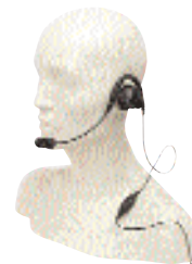
RMN5015 – Сверхпрочная гоночная гарнитура (требует кабеля–адаптера гарнитуры RKN4090)