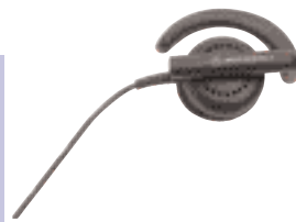
BDN6720 – Головной телефон с жесткими ободами

16-канальная радиостанция CP140 — отличный выбор для работников небольших организаций, которым необходима постоянная и экономичная связь с коллегами и руководством. Пользователи могут переключаться на дополнительный канал, чтобы обсуждать более сложные вопросы один на один.