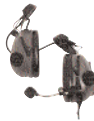
RMN4053 – Жесткая гарнитура, устанавливаемая на головной убор, с пассивной защитой ушей (серая)