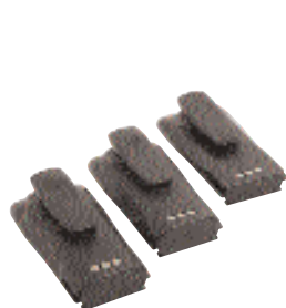
Литий-ионный, никель-кадмиевый и никель-металл-гидридный аккумулятор